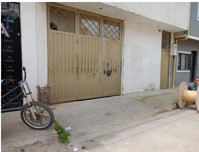
Se recuperan 16m de espacio Publico