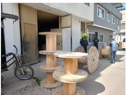
Se Solicita Ingresar material