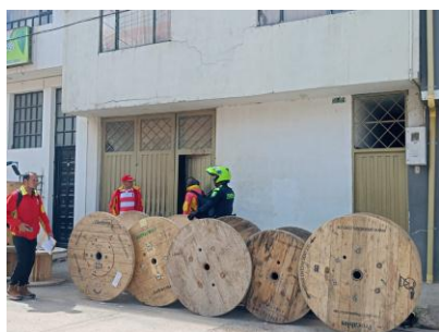
Se evidencia invasión de espacio público